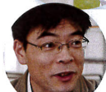
介護施設に通う母を持つAさん