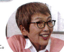
介護施設に通う母Mさん