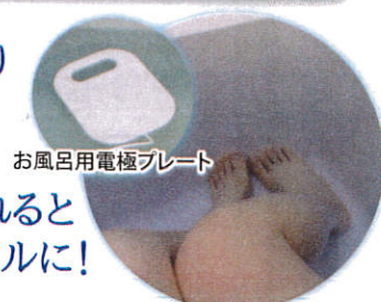
お風呂用電極プレート